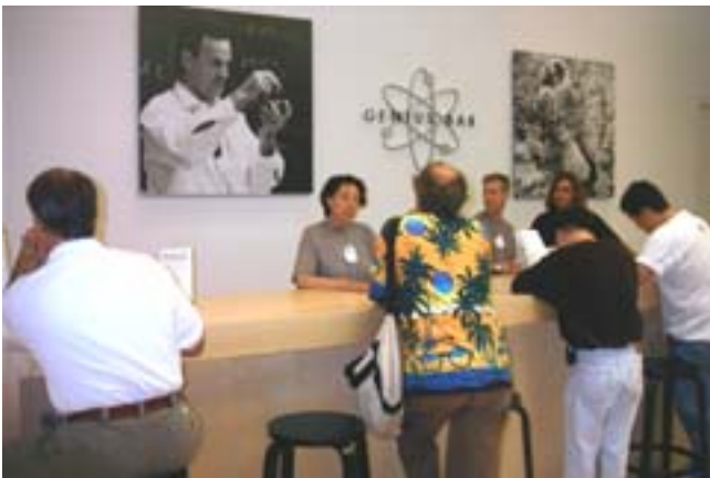
Die Genius Bar, an der Probleme gelöst werden können.