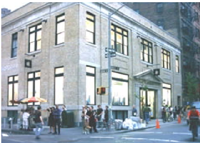
Der Apple Store in Soho, New York