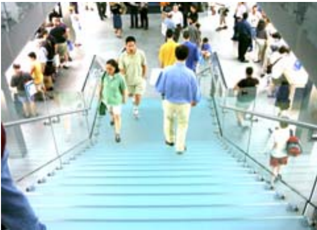
Die Glas-Treppe, die die zwei Stockwerke verbindet.

Hier sind die Innenansichten des Stores: