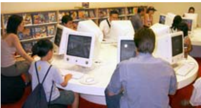
Auch für die kleinen ist gesorgt: An diesen Tischen können Kinder mit ihren Eltern die Computer ausprobieren.